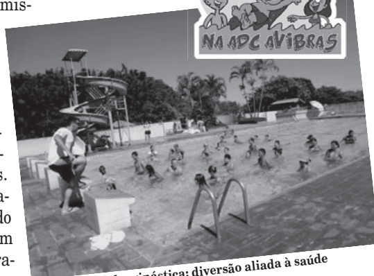
Hidroginástica: diversão aliada à saúde