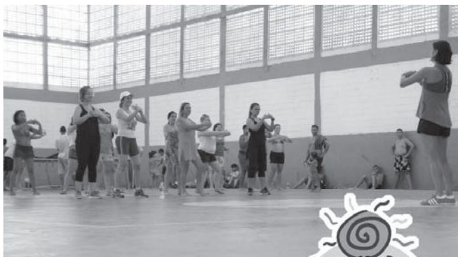
Aula de Zumba foi uma das atrações