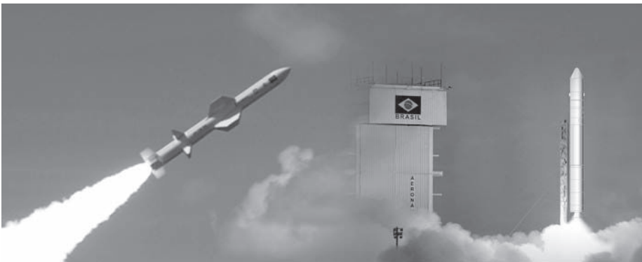
Míssil Tático AV-TM 300 e o desenvolvimento dos processos de carregamento e propelentes do veículo espacial VLM são alguns dos projetos contemplados

Avibras teve os seus 27 projetos aprovados pelo programa Inova Aerodefesa. Lançado em 2013 pelo Governo Federal, o programa visa financiar projetos que beneficiem os setores de defesa e aeroespacial com um orçamento previsto de R$ 2,9 bilhões.