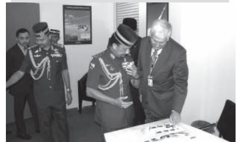
Autoridades militares prestigiam estande da Avibras

A empresa apresentou em seu estande projetos inovadores no setor de defesa e segurança como o ASTROS 2020, o Sistema de Defesa Antiaérea, Aeronave Remotamente Pilotada (ARP) modelo Falcão, Sistema de Comando e Controle Integrados, além de Mísseis.