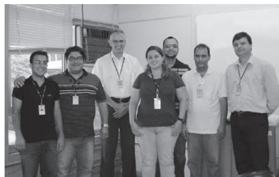
GAD preserva ao máximo a imagem da empresa no que se refere ao crédito junto aos bancos, fornecedores e colaboradores

pagamento dos fornecedores e colaboradores. O setor de Contas a Receber/ Crédito e Cobrança estabelece a política de crédito, realiza cobrança dos recebíveis e acompanha a evolução dos clientes (Serasa). A área de Movimentação Bancária controla as entradas e saídas financeiras junto aos bancos. A Tesouraria/ Planejamento Financeiro elabora fluxo de caixa com objetivo de auxiliar a alta administração na tomada de decisões.