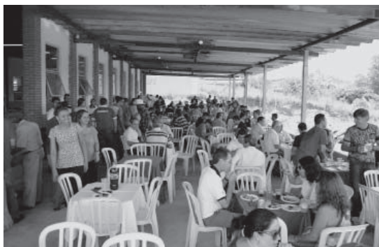
Colaboradores prestigiam churrasco da Avibras na ADC

Na semana do evento alguns colaboradores da Instalação 4 e do setor de obras