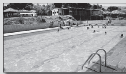
Piscina semiolímpica é atração na ADC da Avibras

Para familiares não dependentes o exame médico custa R$ 8,00 e é cobrada uma taxa no valor de R$ 5,00 para utilização da piscina. Mais informações pelo ramal 6349.