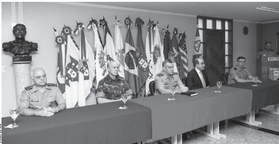
O presidente Sami Hassuani durante a cerimônia de assinatura do contrato de modernização, reforçando ainda mais os laços de confiança e cooperação existentes entre Exército e Avibras

O contrato assinado deverá ser executado ao longo dos próximos quatro anos.