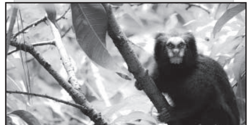
Saguis utilizam as árvores próximas ao prédio para se exibirem aos colaboradores