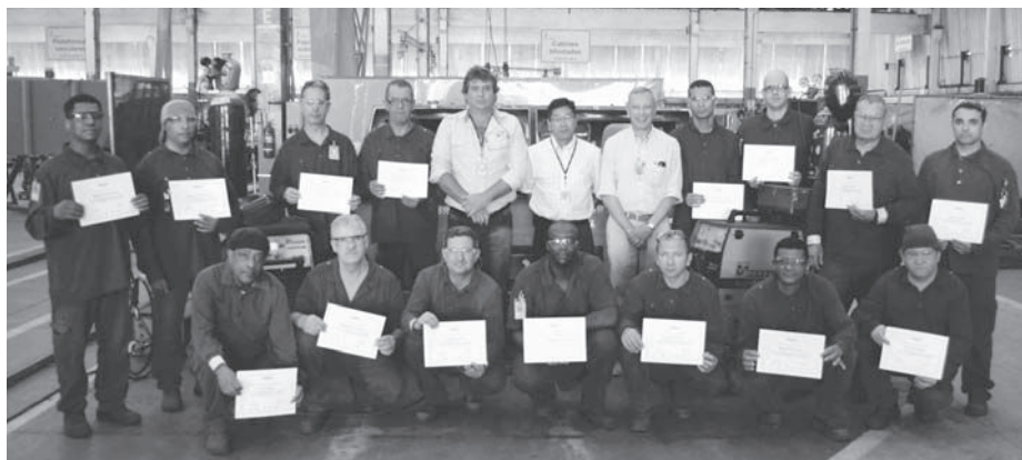
Equipe de soldadores foi certificada pela fabricante dos equipamentos da marca alemã Merkle

A equipe de soldadores da produção veicular recebeu no dia 27 de janeiro o certificado de habilitação em soldagem "High Pulse", após treinamento de qualificação profissional realizado pelo fabricante dos equipamentos da marca Merkle de origem alemã.